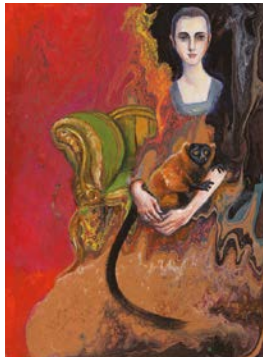
Madagaskar – Künstlerin: Maria Teresa Crawford Cabral

Anmeldungen zur Eröffnungs- veranstaltung erfolgen über www.florence-nightingale- krankenhaus.de/ psy_kunstaussstellung